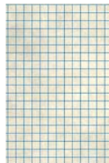
格子幅33 \mu m